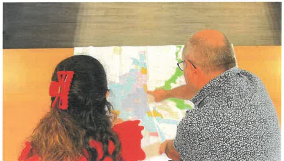
La Communauté de Communes instruit les Autorisations du Droit des Sols pour le compte des Communes du Pays Morcenais

Il faut rajouter à ces chiffres les 132 Déclarations d'Intention d'Aliéner (DIA) qui ont été instruites.