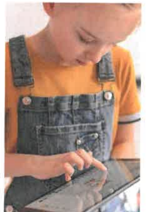
La Communauté de Communes du Pays Morcenais dote les écoles du territoire d'outils informatiques.

La Communauté de Communes prend en charge les cartouches des imprimantes des écoles pour un montant de 3 185,52 € TTC.