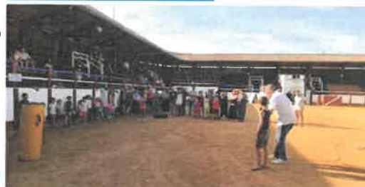
Initiation à la Course Landaise dans le cadre des Estivales en Pays Morcenais