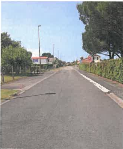
Réfection de la chaussée de la rue Victor Duruy à Morcenx-la-Nouvelle

*Purge de voirie : une purge est une technique qui consiste à évacuer la partie dégradée d'une structure de chaussée (le plus souvent causée par des racines d'arbre) pour la remplacer par une structure saine, porteuse et correctement drainée.