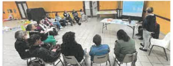
Réunion de préparation du Comité Territorial Parentalité pour la réalisation d'un livret d'informations aux familles.

La promotion du Contrat Local d'Accompagnement à la Scolarité permet de soutenir le CLAS existant porté par l'association CLEM à Morcenx-la-Nouvelle et de l'étendre aux autres communes pour les élèves du primaire et les jeunes scolarisés au collège. L'échange, sur la place et la création d'espaces parents au sein des écoles, favorisera leur expérimentation en 2024 sur quelques écoles.