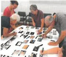
Les élus du territoire réalisant la fresque du climat.

La Fresque du climat est un atelier de sensibilisation au dérèglement climatique. En 2023, la Communauté de Communes du Pays Morcenais a proposé à tous les conseils municipaux des communes membres d'organiser un atelier par commune. Ce sont 52 élus au total qui ont assisté à ces fresques, soit 52% des élus du territoire.