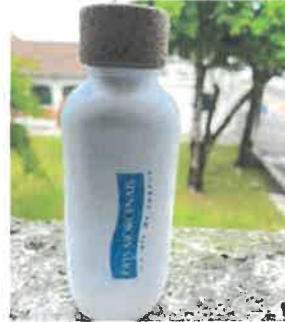
Cette gourde est composée à 98% de biodéchets de canne à sucre. Sa fabrication a utilisé principalement des énergies renouvelables négatives en carbone

130 gourdes, floquées du logo du Pays Morcenais, ont été réalisées, avec une entreprise spécialisée dans la confection d'objets responsables et distribuées aux élus communautaires et aux agents de la Communauté de Communes et du CIAS, afin de sensibiliser à la ressource en eau mais aussi et surtout pour lutter contre la pollution plastique.