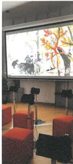
Micro-Folie est un projet porté par le ministère de la Culture français, ouvert aux collectivités territoriales, qui propose l'accès à un musée numérique auquel collaborent douze établissements culturels nationaux fondateurs.

90 participants à l'inauguration 123 fréquentation publique 112 participants sur les 6 séances d'accueil de classes 15 participants sur les 2 séances d'accueil publics spécifiques 17 participants sur 1 séance de vidéo projection 48 participants sur les 2 séances d'accueil tout public.