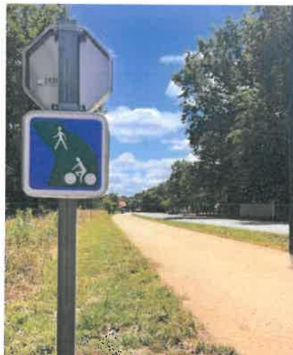
Aménagement de voie verte à Onesse-Laharie