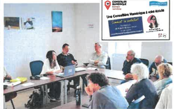
La conseillère numérique organise tout au long de l'année des formations à destination des particuliers et des associations