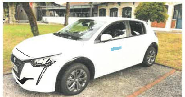
Une des 2 e-208