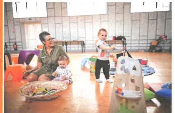
Le Ludobus propose de nombreuses animations au cours de l'année dont certaines sont menées conjointement avec le Relais Petite Enfance.