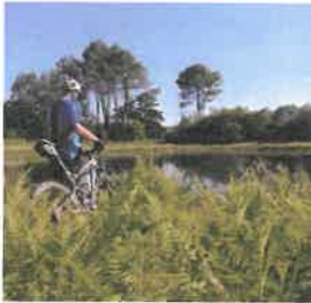
Les mardis découverte Lagune de la Bourouse

Nouveauté 2023 avec des expositions et ateliers gratuits à double objectif : inciter le public du