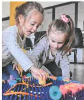
Animation du Ludobus

Nous avons pu observer une fréquentation en hausse des Ludo'bébés avec des familles et des assistantes maternelles, ce qui nous a amenés à réaménager ces séances pour répondre au mieux au public. Nous avons fait l'acquisition de matériels et de jouets pour les moins de 3 ans, avec une demande d'investissement auprès de la CAF et de la MSA.