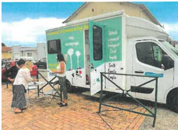
Les deux agents du Bus France Services du Pays Morcenais sillonnent le territoire. Ils tiennent des permanences dans toutes les communes du territoire.