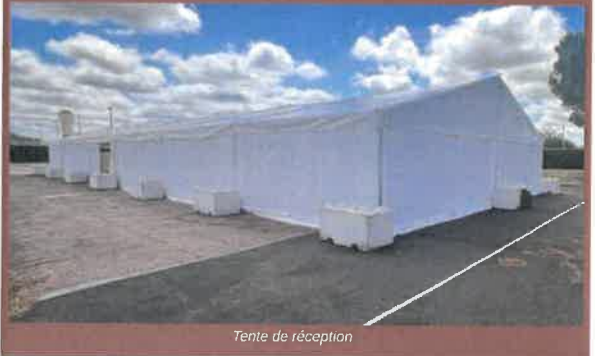
Tente de réception